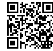
OKIN-Remote Smart Android, Google Play